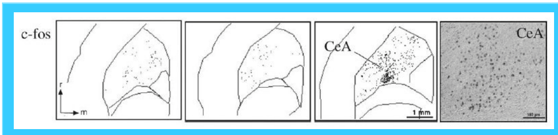
Figura 3 Localización de acúfenos en sistema nervioso central mediante genes inmediatos-tempranos (tomado de Wallhausser-Franke et al., 2003 y Zhang et al., 2003).

sobretudo de la facilidad de poder cuantificar esta activación (Figura 3). Saltó otra sorpresa cuando se cuantificó la activación, apareciendo mucha mayor actividad en áreas no auditivas que en áreas auditivas, llegando a ser casi cuatro veces superior (Figura 4).